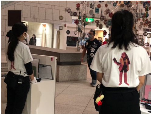
右：PUGMENTがアレンジした衣装 左：Tシャツを着用した案内スタッフ

また、PUGMENT自らも「Who I Truly Am? (私は誰かを考える)」の問いに従って自らアレンジした衣装を撮影し、インスタグラムに投稿しました。 PUGMENTが提案した衣装はTシャツにプリントし、横浜美術館会場にいる案内スタッフが着用して展覧しています。