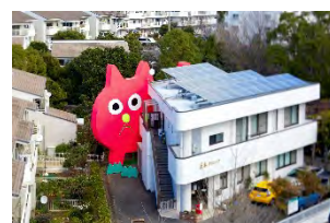
飯川雄大《デコレータークラブ - ピンクの猫の小林さん - 》2020年

昨年度、「猫の小林さんとあそぼう！プロジェクト」を展開し、金沢区並木で巨大な作品《デコレータークラブ - ピンクの猫の小林さん - 》を設置。また、現在は「ヨコハマトリエンナーレ 2020」に参加しています。