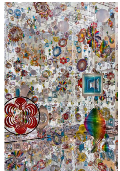
ニック・ケイヴ《回転する森》2016(2020年再制作) ©Nick Cave