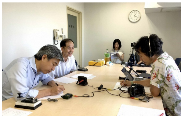
モールス信号録音風景

「ヨコハマサイトのマップ」と各サイトの解説は、公式WEBサイト「ヨコハマサイト」ページからダウンロードできます。 URL http://yokohamatriennale.jp/2017/event/2017/07/event13.html.html