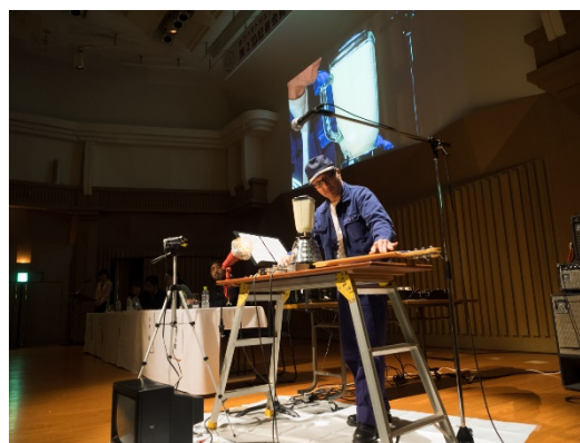
4月18日「第2回記者会見」でのパフォーマンス

1964年東京都生まれ。90年代より「LOVE ARM（ラヴ・アーム）」シリーズをはじめとするサウンドスカルプチャーを制作、またそれらを使ったライブパフォーマンスを行っている。2004年からは、大量消費社会が急速に拡大した20世紀以降の「物質世界のリサーチ」を基盤に、楽器、家電製品や自動車、家具、中古レコードなど、世界中どこにでもある日常的なモノと技術を再構成し、近代の文化を再定義するサウンド／スカルプチャー／パフォーマンスの複合プロジェクト「The Rotators」に取り組み、日本のみならず世界各地の展覧会に参加している。