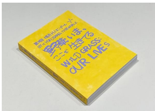
上：公式カタログ 日本語版表紙 右：展示解説ページサンプル