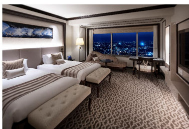
横浜ロイヤルパークホテル