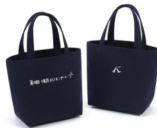
キタムラオリジナルバッグ