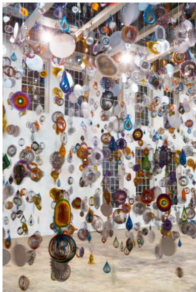
《回転する森》2016 ©Nick Cave, Courtesy of the artist and Jack Shainman Gallery, Photo by James Prinz