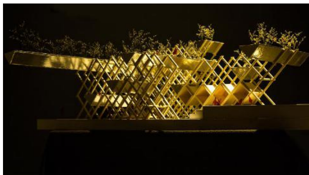
《THE SPACE COALITION》2020