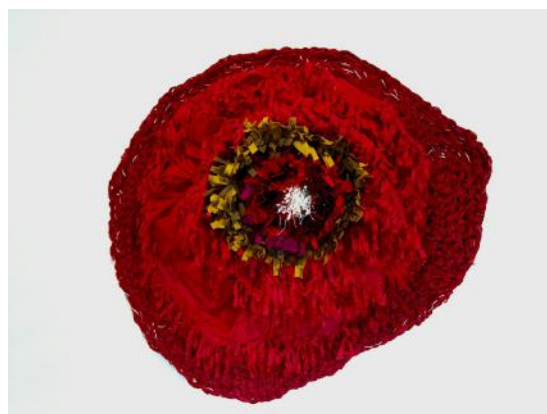
《満開》2019 ©伊誕創藝視界企業社, Photo by 王言度