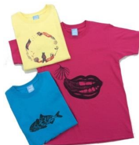
葛西絵里香 Tシャツ ¥3,780円(税込) size: XS/S