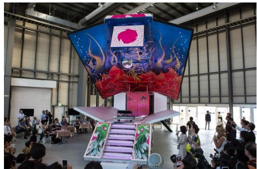
やなぎみわ《演劇公演「日輪の翼」のための移動舞台車》2014年