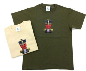
やなぎみわ Tシャツ ¥2,160円(税込) size: 160/S/M/L/XL