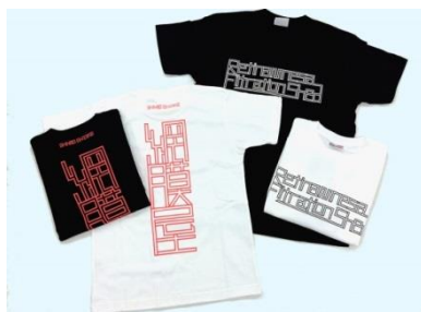
大竹伸朗 Tシャツ ¥3,780円(税込) size: Jr.Large/S/M/L