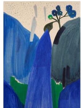
三嶋安住《青い水晶》2014