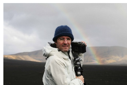
『オラファー・エリアソン 視覚と知覚』 Jacob Jørgensen, JJFilm, Denmark