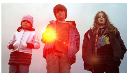
『あなたはここにいる』