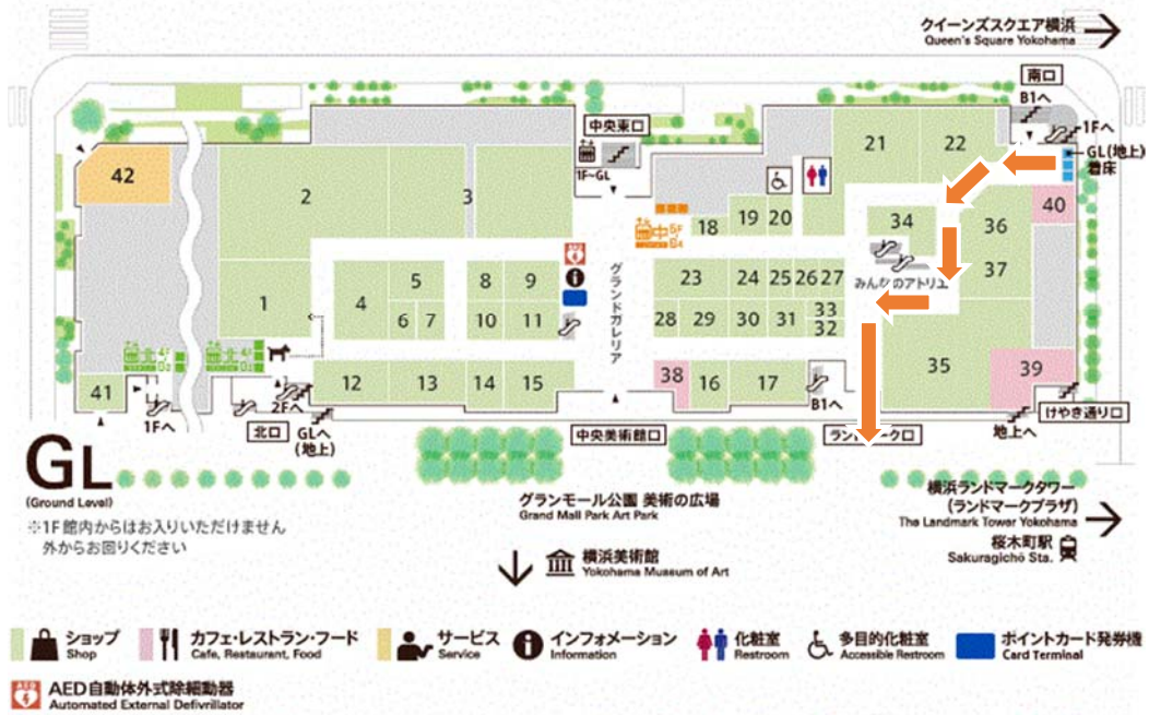
上記フロア図の右上部分から、オレンジ色の矢印に沿って進み、屋外に出ます。