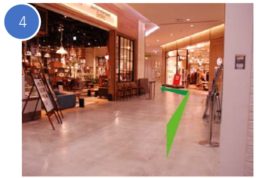
MARK IS みなとみらい店内を左に進みます。