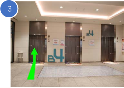
南エレベーターで1階まであがります。 ※午前10時以降のみ運転