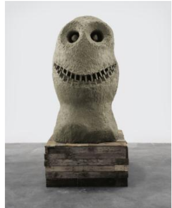
(写真)ウーゴ・ロンディノーネ/Ugo RONDINONE 《moonrise.east.march》2005

現代アートの国際展ヨコハマトリエンナーレ2011では小中学生のみなさんにより積極的にアート(美術作品)を楽しんでもらう企画として、キッズ・アートガイドを募集します!