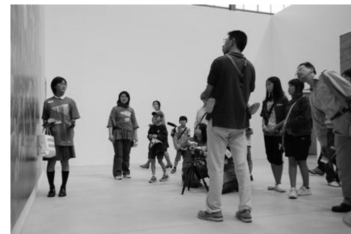
(写真)横浜トリエンナーレ2008での様子。 今回はワークショップを重ねてさらにパワーアップします!!

6月12日(日)の説明会の際に、キッズ・アートガイド2011の詳細を説明の上、皆様に参加同意書をお渡しします。内容をご理解いただいた上であらためて本事業への参加の意思を確認させていただきます。