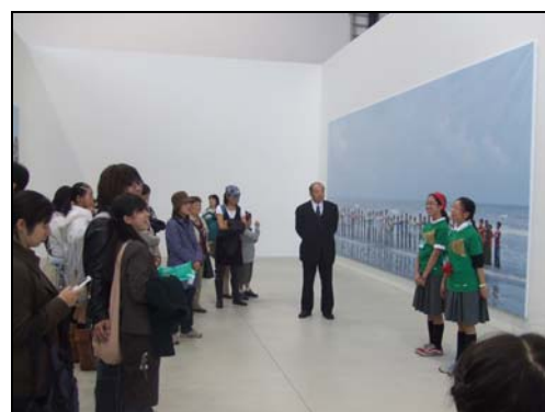
※前回展（横浜トリエンナーレ 2008）での様子

8月10日（水）、8月19日（金）、8月22日（月）、 9月11日（日）、9月25日（日）、10月2日（日）、 10月16日（日）、10月30日（日）の計8日実施