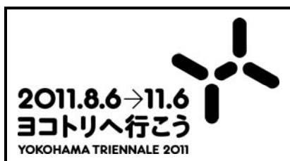
※ヨコハマトリエンナーレ 2011 応援企画ロゴ1

別添「ヨコハマトリエンナーレ 2011 応援企画 募集要項」をお読みいただき、ヨコハマトリエンナーレ 2011 応援企画申請書（第 1 号様式）へ必要事項をご記入の上、郵送にて創造都市推進課までご申請ください。